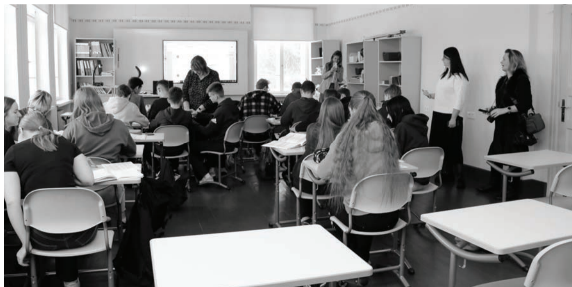
Skolēni eksperimentē fizikas mācību stundā